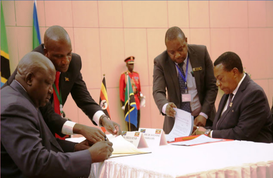
Waziri wa Mambo ya Nje na Ushirikiano wa Afrika Mashariki kutoka Serikali ya Jamhuri ya Muungano wa Tanzania, Balozzi Dkt. Augustine Mahiga (kulia) na Waziri wa Mambo ya Nje wa Uganda Oryem Henry Okello

Vilevile alimpongeza Rais Magufuli kwa ujenzi wa Reli ya Kiwango cha Kimataifa (Standard Gauge Railway) kutoka Dar es Salaam mpaka Mwanza na Isaka mpaka Rwanda ambapo itasaidia ujenzi wa bandari kavu katika Mkoa wa Mwanza hivyo wafanyabiashara wa Uganda kunufaika na bandari hiyo ambayo itakuwa karibu zaidi kuliko ilivyo kwa Dar es Salaam.