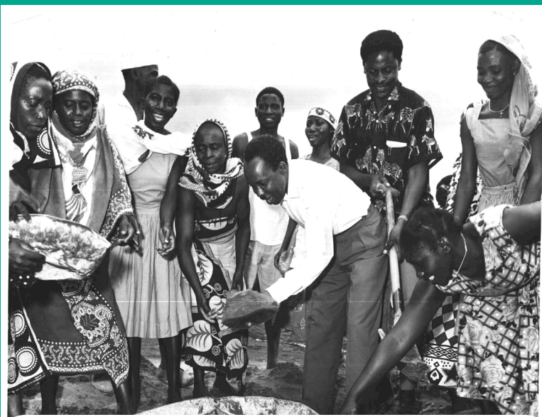
Hayati Baba wa Taifa Mwalimu Julius Kambarage Nyerere akishiriki shughuli ya ujenzi katika kijiji cha Ujamaa wakati wa uongozi wake