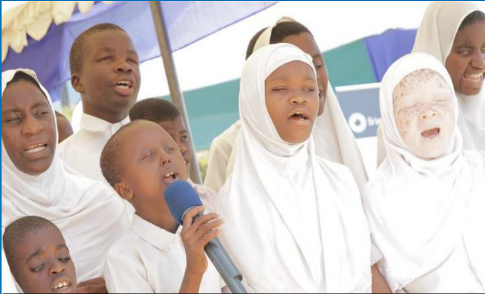
Wanafunzi wa shule ya msingi uhuru mchanganyiko wakiimba wimbo maalum