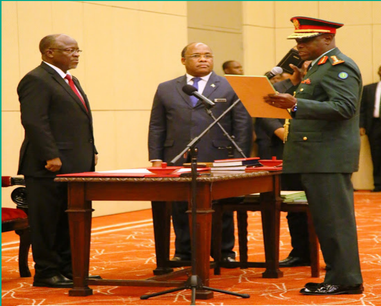
Mkuu wa Jeshi la Wananchi Tanzania (JWTZ) Generali Venance Mabeyo akila kiapo cha utii mbele ya Rais wa Jamhuri ya Muungano wa Tanzania Dkt. John Pombe Magufuli Ikulu jijini Dar es Salaam. Katikati ni Katibu Mkuu Kiongozi Balozi John Kijazi.