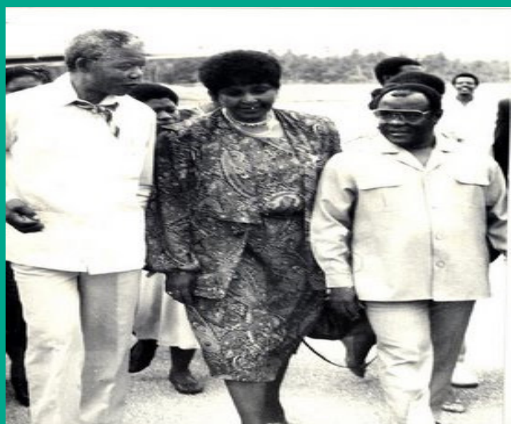
Hayati Makamu wa Rais, Dkt. Omar Ali Juma(kulia) akiwa na aliyekuwa Rais wa Afrika Kusini, Mzee Nelson Mandela pamoja na mkewe Winnie Mandela walipokuja nchini Februari 1990