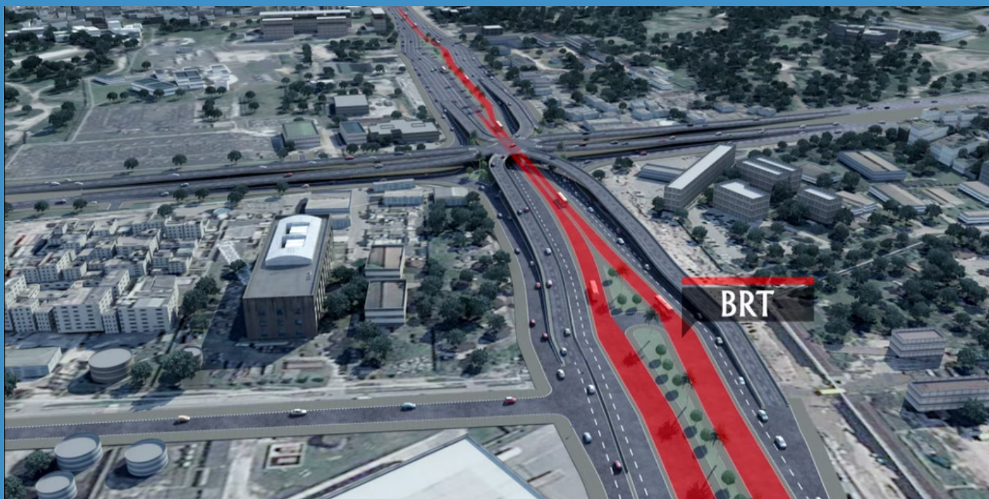
Muonekano wa Barabara ya juu (fly over) ya Ubungo (Ubungo Road interchange)