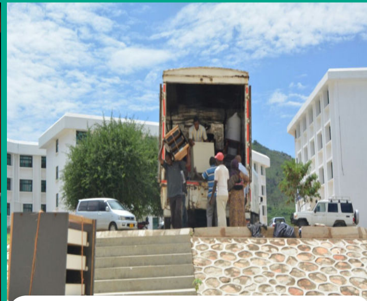
Baadhi ya wafanyakazi wa Wizara ya Afya wakishusha vifaa vya ofisi mjini Dodoma vikitokea Jijini Dar es Salaam, kutekeleza ahadi ya Serikali ya kuhamia Makao Makuu ya nchi, Dodoma