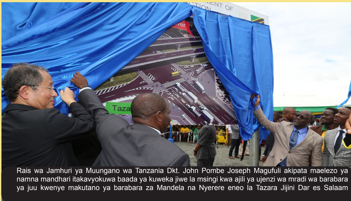
Rais wa Jamhuri ya Muungano wa Tanzania Dkt. John Pombe Joseph Magufuli akipata maelezo ya namna mandhari itakavyokuwa baada ya kuweka jiwe la msingi kwa ajili ya ujenzi wa mradi wa barabara ya juu kwenye makutano ya barabara za Mandela na Nyerere eneo la Tazara Jijini Dar es Salaam

hicho kimesaidia kuendelea na kukamilika kwa miradi mingi ya maji mijini na vijijini itakayosaidia sana maisha ya wananchi.