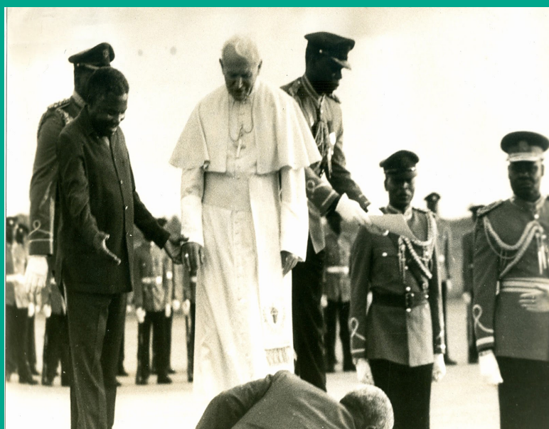
Rais Ali Hassan Mwinyi akimsindikiza Baba Mtakatifu, Papa John Paul II baada ya kuhutubia katika viwanja vya Jangwani