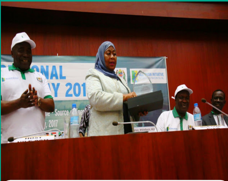
Makamu wa Rais Mama Samia Suluhu Hassan akionyesha tuzo aliyokabidhiwa wakati wa sherehe za Siku ya Mto Nile Jijini Dar es Salaam. Sherehe hizo zimeshirikisha takribani nchi 10 zinazozunguka mto Nile