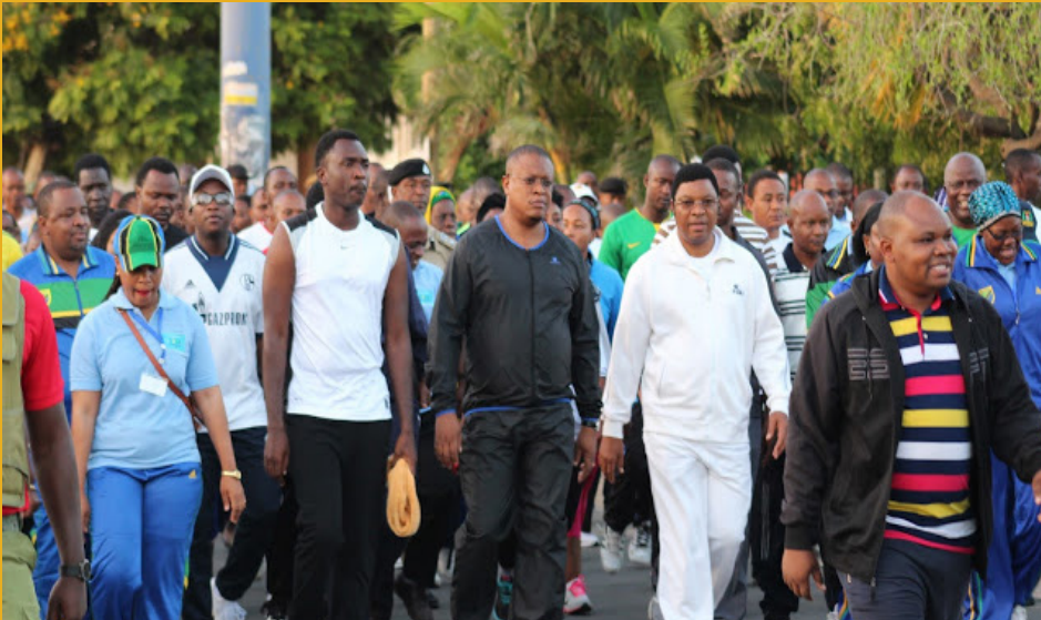
Waziri Mkuu wa Jamhuri ya Muungano wa Tanzania, Mhe. Kassim Majaliwa (aliyevaa traksuti nyeupe) akiwa ameongozana na Viongozi mbalimbali kwenye Mazoezi ya Viungo kwa Wananchi wote yaliyofanyika Uwanja wa Jamhuri mjini Dodoma

ya Jamii, Jinsia, Wazee na Watoto ya kupambana na magonjwa yasioambukiza kwa kufanya mazoezi.